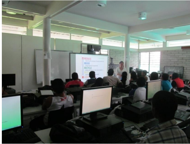
Imagen 4. Taller: Consumo Responsable y Separación de Residuos