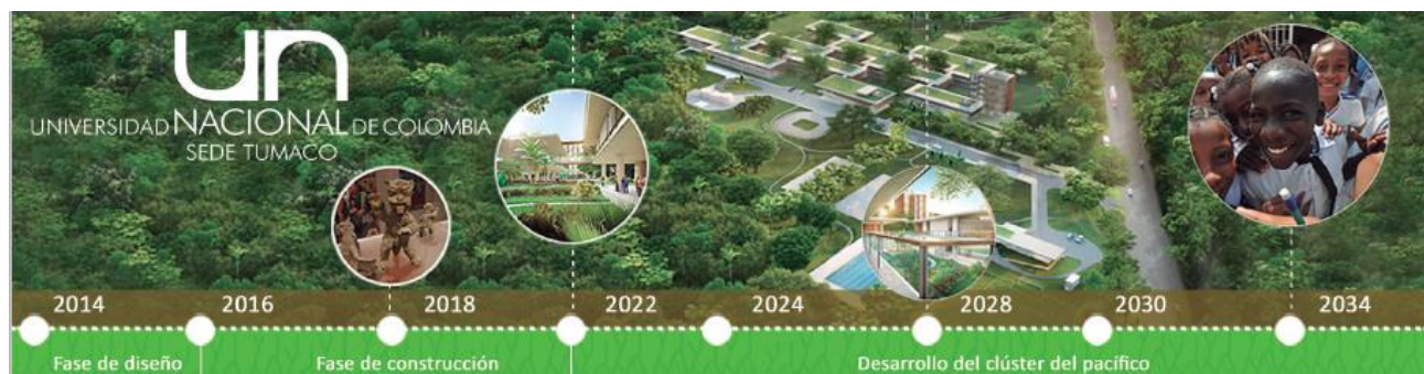
Imagen 1. Universidad Nacional de Colombia-Sede Tumaco, línea de tiempo

Con el objetivo de implementar su infraestructura física, la Sede Tumaco ha gestionado recursos a través de la participación en convocatorias de cooperación nacional e internacional, y ha consolidado alianzas estratégicas con el gobierno local y regional, así como con entidades del orden nacional. La gestión de estos recursos ha permitido definir un horizonte de tiempo en el proceso de implementación de la Sede, tal como se presenta a continuación: