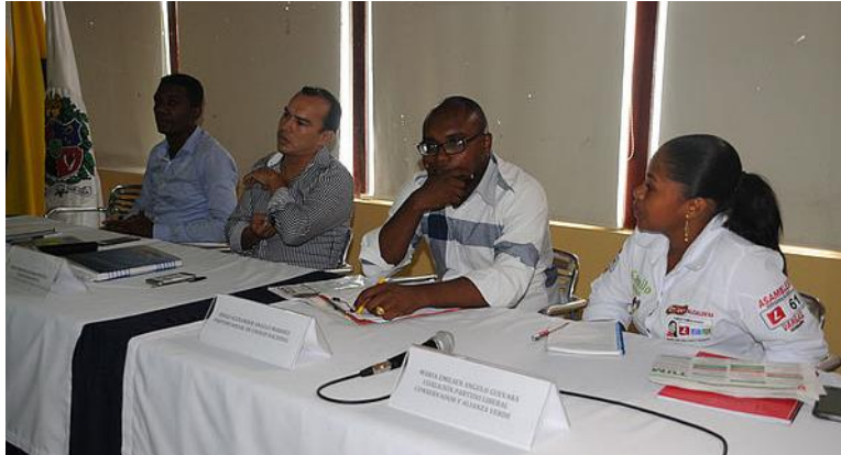
Imagen 8. Foro: de candidatos a la Alcaldía de Tumaco, septiembre 2015

Este foro, moderado por los directivos de la Sede, permitió dar a conocer a los principales medios de comunicación las propuestas programáticas de los candidatos a la alcaldía, así como sus puntos de vista sobre diferentes temas de importancia para el municipio como educación, saneamiento básico, entre otros.