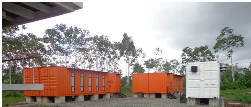
Imagen 2. Instalaciones provisionales Universidad Nacional de Colombia-Sede Tumaco

Con el fin de ampliar la infraestructura de la Sede Tumaco, dado su crecimiento escalonado y de alta demanda por parte de los jóvenes de la región (Ver Gráfica 1. Admisiones Sede Tumaco), se implementó la estrategia de dotar a la Sede con instalaciones provisionales a manera de contenedores correspondientes a 120 m 2 de aulas y 30m 2 de batería de baños (Ver Imagen 2. Instalaciones provisionales Sede Tumaco). Estas instalaciones, en conjunto con la actual infraestructura física de la Sede, estarán en funcionamiento para el desarrollo de las actividades académicas previas a la construcción del campus.