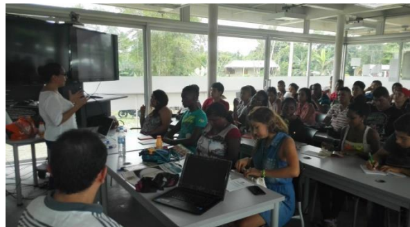
Imagen 10. Actividades de acompañamiento a estudiantes del PEAMA

Así mismo, dentro del área de acompañamiento integral se desarrolló entre el 21 y 23 de septiembre de 2015, la primera Semana Universitaria de la Sede Tumaco. A continuación se presentan las actividades de acompañamiento integral desarrolladas en el 2015 por la Sede Tumaco: