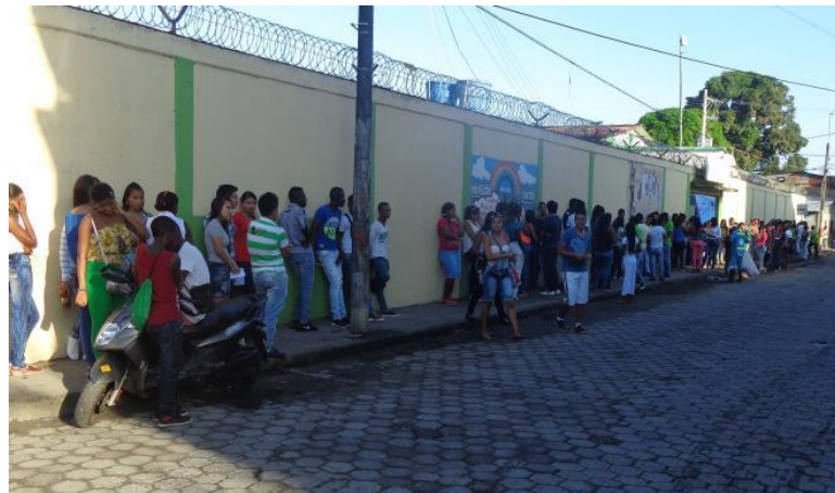
Imagen 5. Universidad Nacional de Colombia-Sede Tumaco, prueba de admisión

En corto tiempo la Sede Tumaco ha demostrado la pertinencia de la presencia de la Universidad en el pacífico, con una amplia participación de los jóvenes de la región en el proceso de admisión. Es así que, el promedio de aspirantes en los procesos de admisión iniciales a la Sede Tumaco es a la fecha de aproximadamente mil jóvenes interesados en ingresar a la Universidad por semestre, lo cual demuestra un importante avance a pesar de las restricciones de