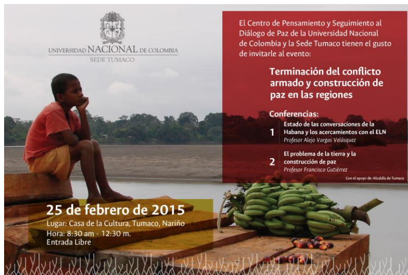
Imagen 7. Pieza gráfica divulgación del foro: terminación del conflicto armado y construcción de paz en las regiones