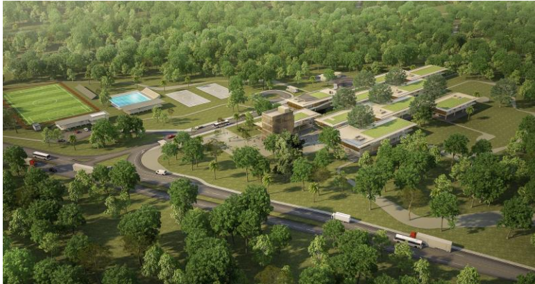
Imagen 3. Renders Campus Sede Tumaco