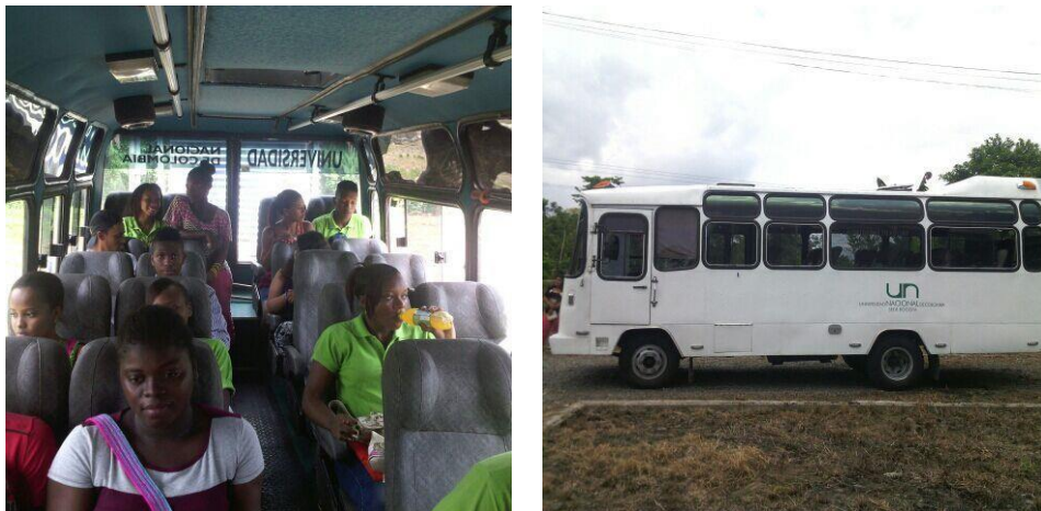
Imagen 11. Actividades de fomento socioeconómico a estudiantes del PEAMA

En el área de Gestión y fomento socio-económico , se priorizó la consolidación de alianzas estratégicas internas y externas. En 2015 se beneficiaron del apoyo de transporte 30 estudiantes en el primer semestre y 52 estudiantes durante el segundo semestre. Este apoyo se logró gracias al préstamo de dos vehículos por parte de la Sede Bogotá.