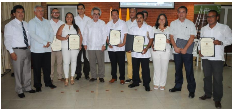
Imagen 6. Primera ceremonia de graduación de la Universidad Nacional de Colombia en la Sede Tumaco

El pasado 14 de septiembre de 2015 se llevó a cabo la primera ceremonia de graduación en la Sede Tumaco de la Universidad. De esta manera, la ceremonia contó con 11 graduandos de la Especialización en Cultivos Perennes Industriales de la Facultad de Ciencias Agrarias realizada en convenio con la Sede Tumaco, lo que representa un importante resultado en el corto tiempo de operación de la Sede e impacta de forma directa al sector empresarial, ya que varios de los egresados pertenecen a empresas de Palma de la región.