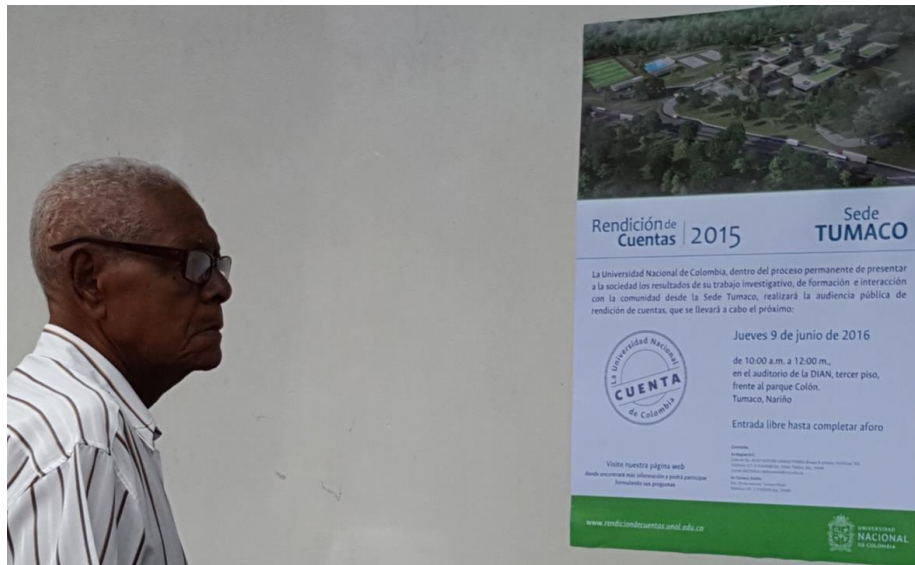
Fotografía 14 Junio 2016 Habitante de Tumaco observa pieza de divulgación de la jornada de rendición de cuentas

En el ejercicio de rendición de cuentas de la Universidad, la Sede Tumaco realizó exitosamente su audiencia pública de rendición de cuentas en las instalaciones de la DIAN del Municipio de Tumaco. Esta contó con la asistencia de la comunidad universitaria de la Sede y la población en general por su carácter abierto al público 14 .