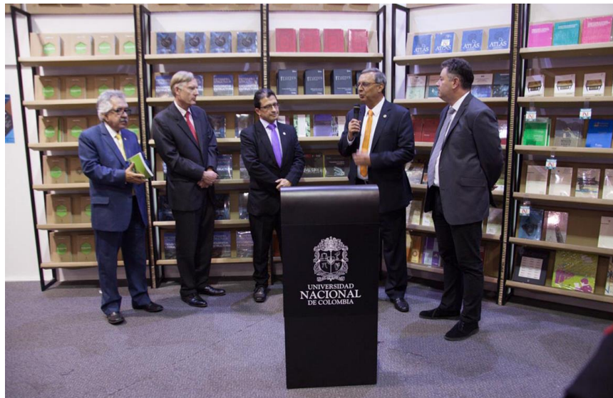
Fotografía 10 Feria del Libro 2016 Lanzamiento publicación Fase de Diseño

En la Feria Internacional del Libro de abril de 2016 se lanzó la publicación: Tumaco Pacífico Campus Fase de Diseño, la cual contó con la presencia del anterior Embajador del Reino de Países Bajos, Robert van Embden, el señor Rector de la Universidad, y demás invitados especiales. Estos productos permiten dar a conocer los avances de la Sede Tumaco 10 .