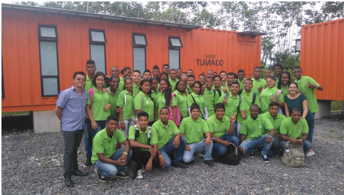
Fotografía 15 Participantes semanas de inducción 2016