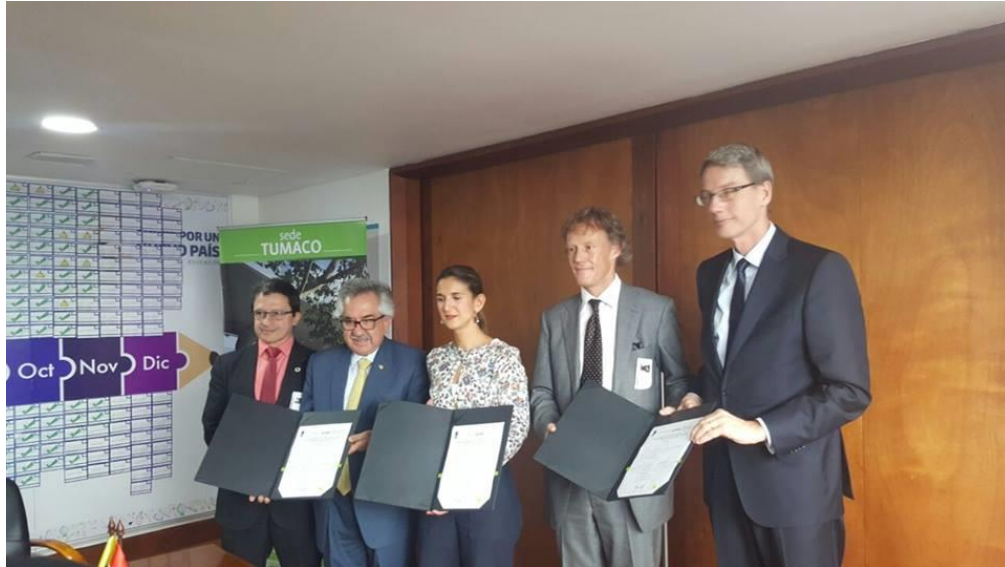
Fotografía 2 Noviembre 29 de 2016 Suscripción del acuerdo de Subvención ORIO Construcción y Operación del proyecto Tumaco Pacífico Campus

En el ámbito de la investigación y la extensión, el Instituto de Estudios del Pacífico (IEP) de la Sede Tumaco ha participado activamente en convocatorias internas y externas, y ha adelantado actividades en pro del fortalecimiento de alianzas con entidades de locales. Dentro de los resultados obtenidos por el IEP en el 2016 se destaca el desarrollo de tres proyectos de extensión con la Dirección General Marítima, que han permitido destacar la capacidad de ejecución de proyectos en diferentes áreas de asesoría y consultoría.