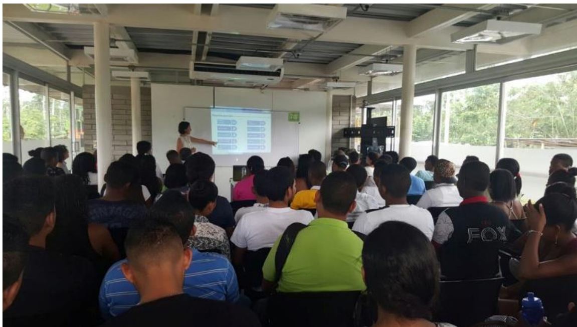
Fotografía 5 Marzo 31 de 2016 Charla Fulbright