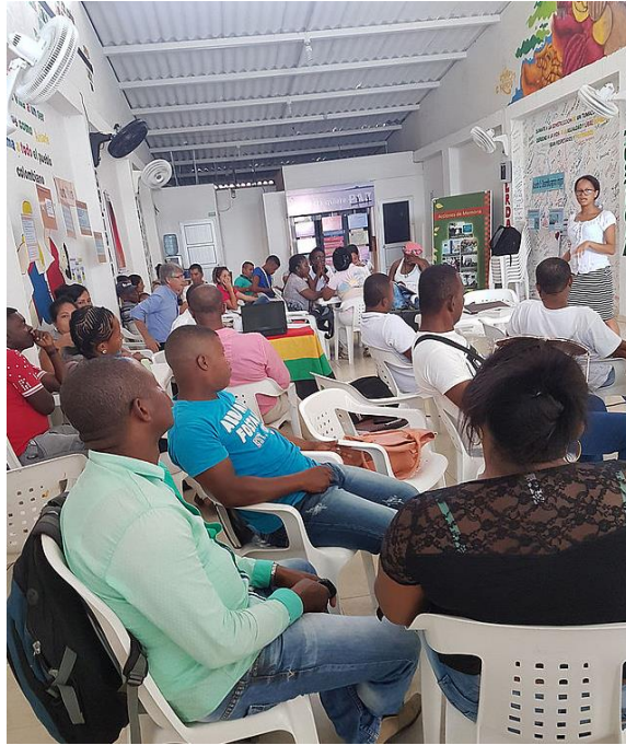
Fotografía 18 Taller de Paz y Liderazgo Territorial Noviembre 2016