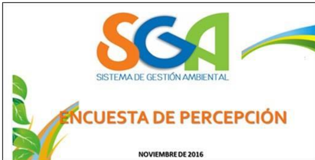
Imagen 4 Encuesta de percepción

También, se han empezado a implementar los siguientes programas del Sistema de Gestión Ambiental en la Sede Tumaco: