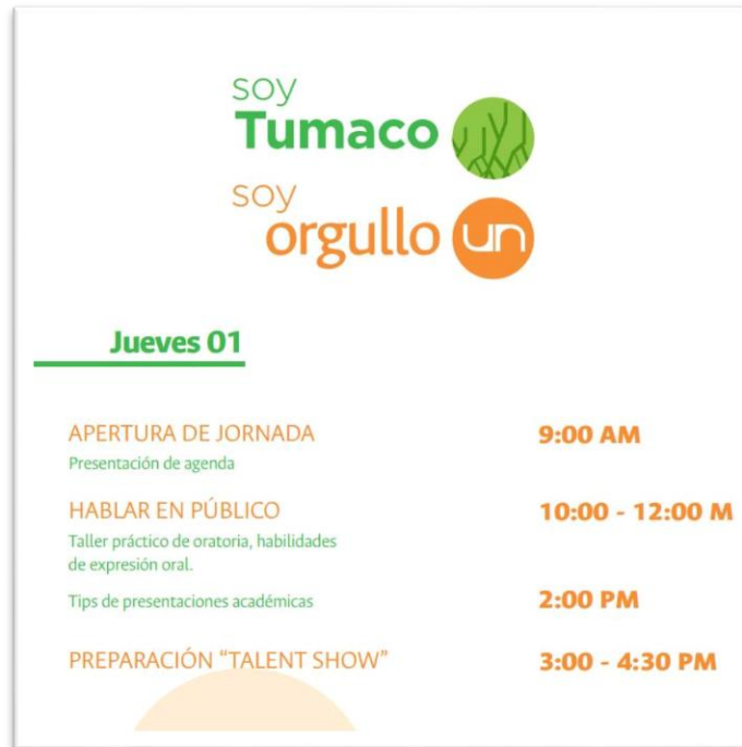
Imagen 1 Poster Soy Tumaco Soy Orgullo