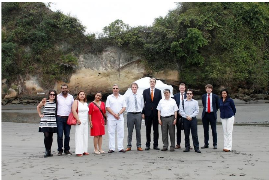
Fotografía 8 Noviembre 30 de 2016 Visita a Tumaco de Delegación del Gobierno del Reino de los Países Bajos