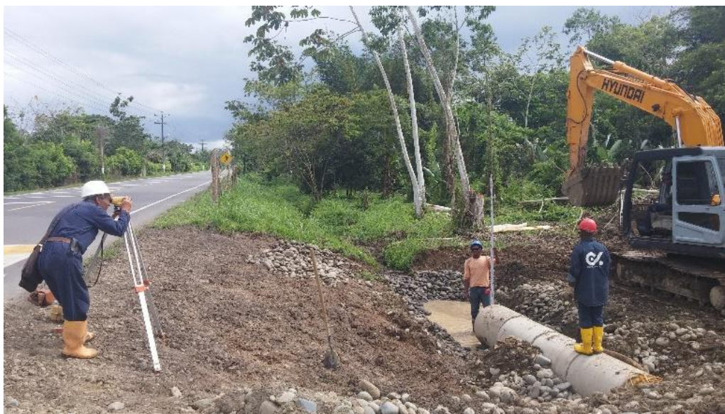
Fotografía 12 Obras de bienestar Sede Tumaco 2016

También, se han realizado los procesos precontractuales para el desarrollo de: