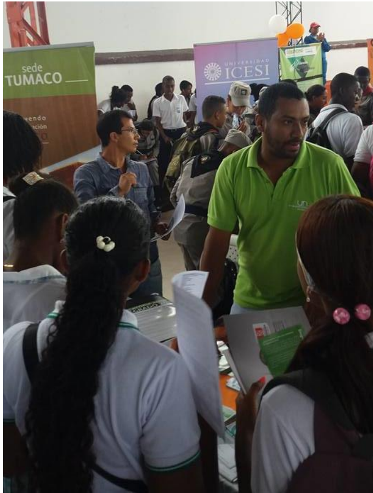
Fotografía 13 Agosto de 2016 Feria de Educación Superior, Municipio de Tumaco

Adicionalmente, se fortalecieron relaciones con rectores, alcaldes y coordinadores de Instituciones educativas ubicadas en las costas del litoral pacífico nariñense, siendo uno de los logros de esta gestión alcanzar un acuerdo entre Dirección de sede y Alcaldía municipal para obtener subsidio (50%) de transporte para estudiantes y monitores.