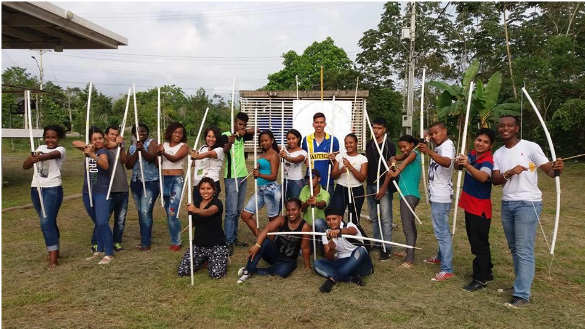
Fotografía 17 Taller arquería Semana Universitaria, Sede Tumaco

Se realizaron actividades propias de la Semana Universitaria tanto en Villa garzón, como en Tumaco. Esta última contó con la presencia de varios docentes y estudiantes de la Universidad Nacional de Colombia de las diferentes facultades con una propuesta llamada: Espacios de Re conocimiento para la Paz.