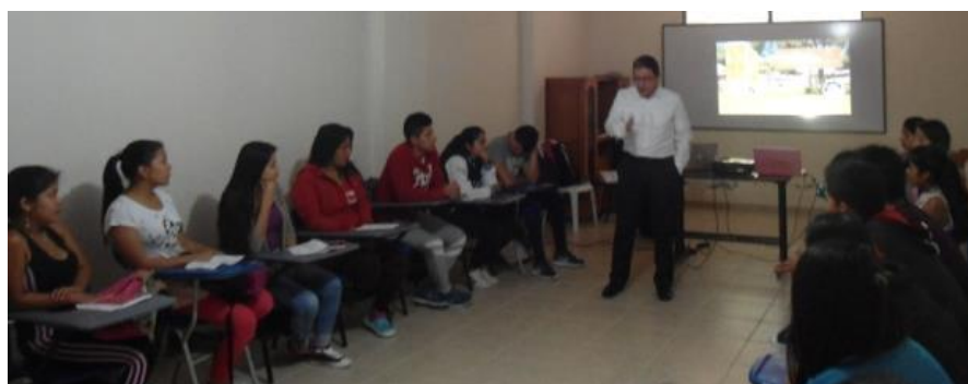
Fotografía 16 Director de Sede, bienvenida en Villa Garzón, Putumayo

Durante el año 2016 se contó con practicantes de Psicología (2) quienes apoyaban el Bienestar Universitario en la Sede, participando en: la intervención e integración comunitaria, cine foros, celebración de eventos especiales y formación en valores, entre otras.