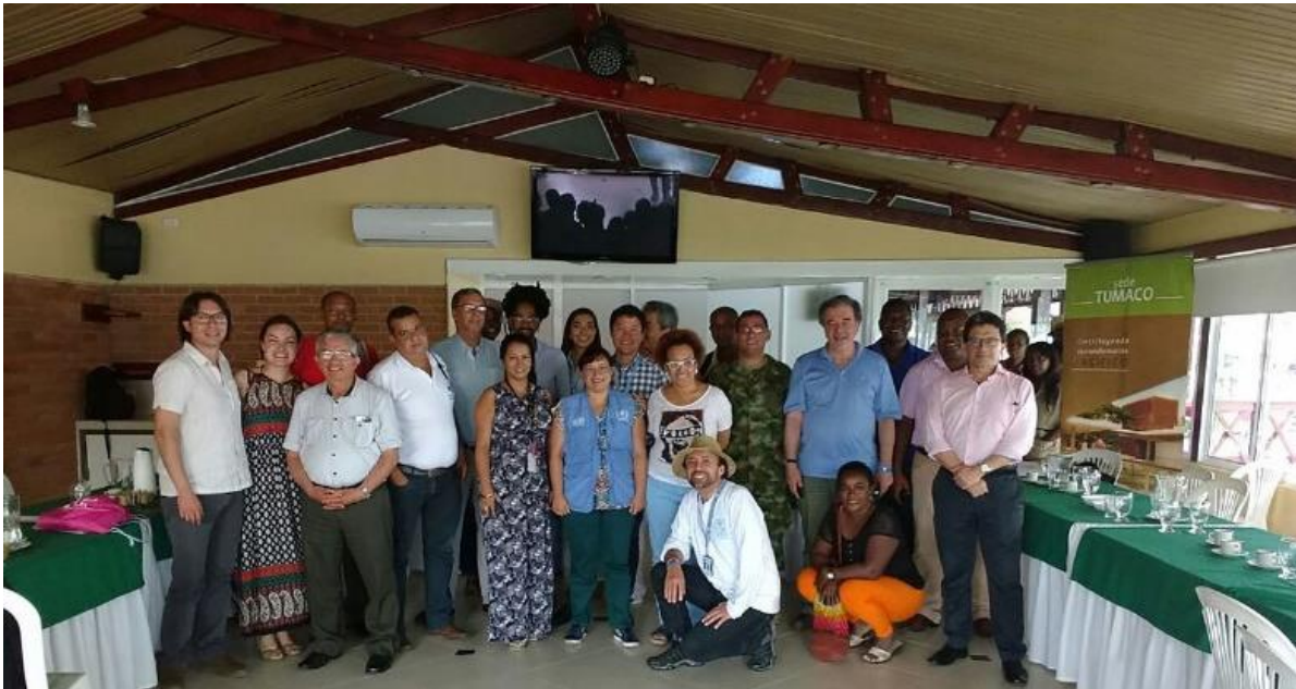
Fotografía 19 Taller sobre Paz y Liderazgo Territorial

Asimismo, dada su ubicación estratégica, la Sede Tumaco es convocada a participar en el diplomado “Universidad, Región y Construcción de Paz” liderado por el Centro de Pensamiento y Seguimiento al Dialogo de Paz de la Universidad y el Ministerio de Educación Nacional, en el cual participaron cerca 17 instituciones de educación superior