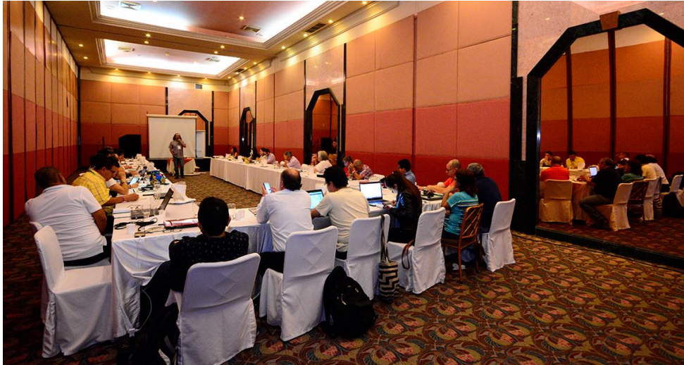
Fotografía 20 Septiembre 2016 Diplomado “Universidad, Región y Construcción de Paz”

del país en torno a las propuestas que se deben generar desde la academia en el marco del posconflicto.