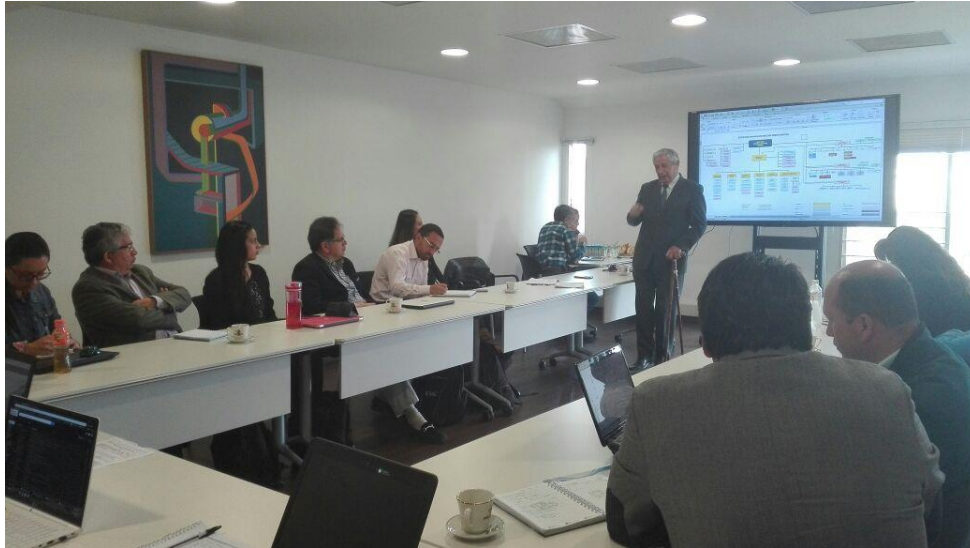
Fotografía 11 Reunión de integración proyectos DIMAR-UNAL

Adicionalmente, el IEP ha participado activamente en la presentación de propuestas internas y externas. Por ejemplo, en el ámbito interno se formuló un proyecto de extensión solidaria: