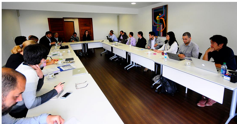
Fotografía 7 Reunión equipo de tsunami, proyecto SATREPS Colombia

Asimismo, la Sede ha tomado el liderazgo del proyecto SATREPS (Science and Technology Research Partnership for Sustainable Development) Colombia, el cual está enfocado en la investigación en “Tecnologías avanzadas para el fortalecimiento de la investigación y respuesta a eventos de la actividad sísmica, volcánica y tsunami, y el mejoramiento de la gestión del riesgo en la República de Colombia”, en el cual participan diferentes entidades del orden nacional como el Servicio Geológico colombiano, la Dirección General Marítima, la Unidad Nacional para la Gestión del Riesgo de Desastres –UNGRD, entre otros. Este es un proyecto a 5 años, en 2016 continuo avanzando exitosamente gracias al apoyo de los diferentes investigadores y colaboradores que participan en él 7 .