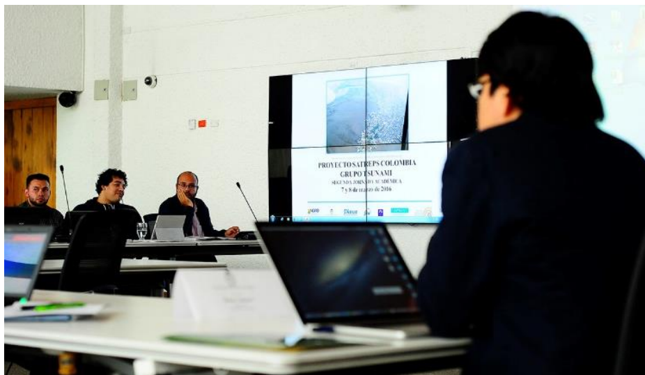
Fotografía 6 Taller de modelación tsunami

Asimismo, la Sede ha tomado el liderazgo del proyecto SATREPS (Science and Technology Research Partnership for Sustainable Development) Colombia, el cual está enfocado en la investigación en “Tecnologías avanzadas para el fortalecimiento de la investigación y respuesta a eventos de la actividad sísmica, volcánica y tsunami, y el mejoramiento de la gestión del riesgo en la República de Colombia”, en el cual participan diferentes entidades del orden nacional como el Servicio Geológico colombiano, la Dirección General Marítima, la Unidad Nacional para la Gestión del Riesgo de Desastres –UNGRD, entre otros. Este es un proyecto a 5 años, en 2016 continuo avanzando exitosamente gracias al apoyo de los diferentes investigadores y colaboradores que participan en él 7 .