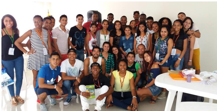
Fotografía 4 Diciembre 3 de 2016 Evento Soy Tumaco Soy Orgullo UN

Evento Soy Tumaco soy Orgullo UN , realizado entre el 1 y 3 de diciembre de 2016 contó con la participación de más de 80 participantes, en donde se cumplió con el objetivo de propiciar un espacio enriquecedor que promueva la integración los estudiantes de la sede Tumaco a la institución, por medio de experiencias que fortalezcan el sentido de pertenencia a la U.N, favoreciendo su permanencia. Estas actividades también buscan la “Promoción de los valores institucionales que propicien en la comunidad el sentido de pertenencia”, de los ejes misionales del PGD 2016-2018.