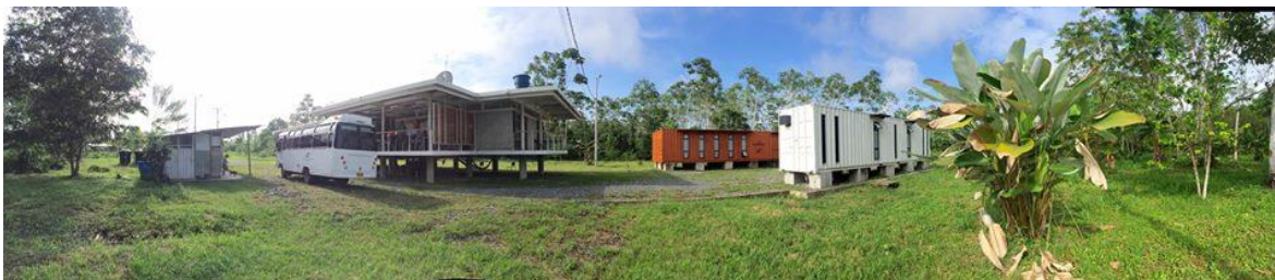
Fotografía 3 Universidad Nacional de Colombia - Sede Tumaco 2016

A continuación se presentan los principales logros alcanzados por la Sede Tumaco de acuerdo con los programas establecidos en el Plan Global de Desarrollo 2016-2018 “Autonomía responsable y excelencia como hábito”, estos incluyen las actividades adelantadas por la Sede en el 2016.