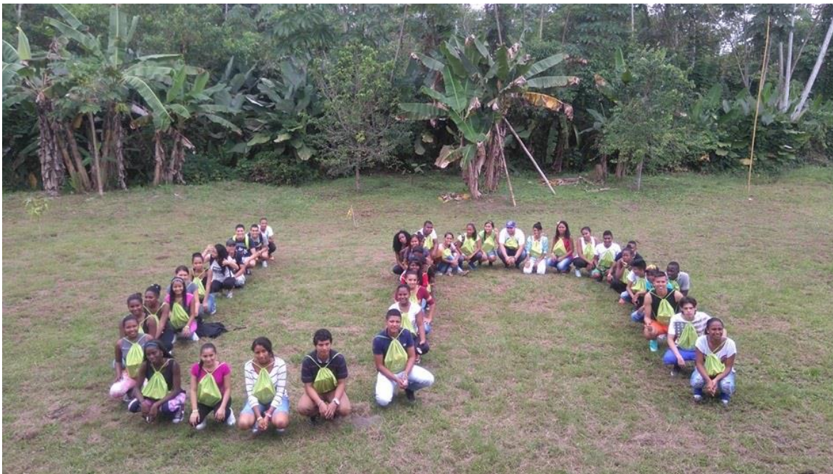
Fotografía 1 Agosto de 2016 Semana de inducción Sede Tumaco